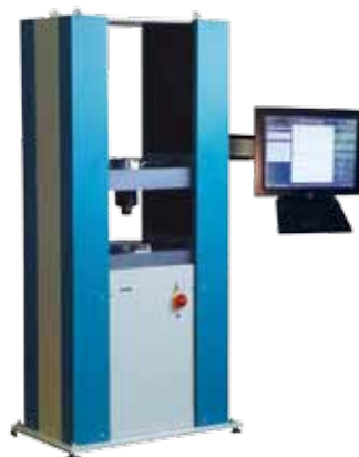
35-5100 Universalprüfmaschine 200 kN Universal Testing Machine 200 kN