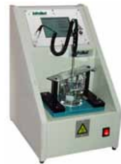
20-2200 Ring- und Kugelautomat Automatic Ring and Ball Tester